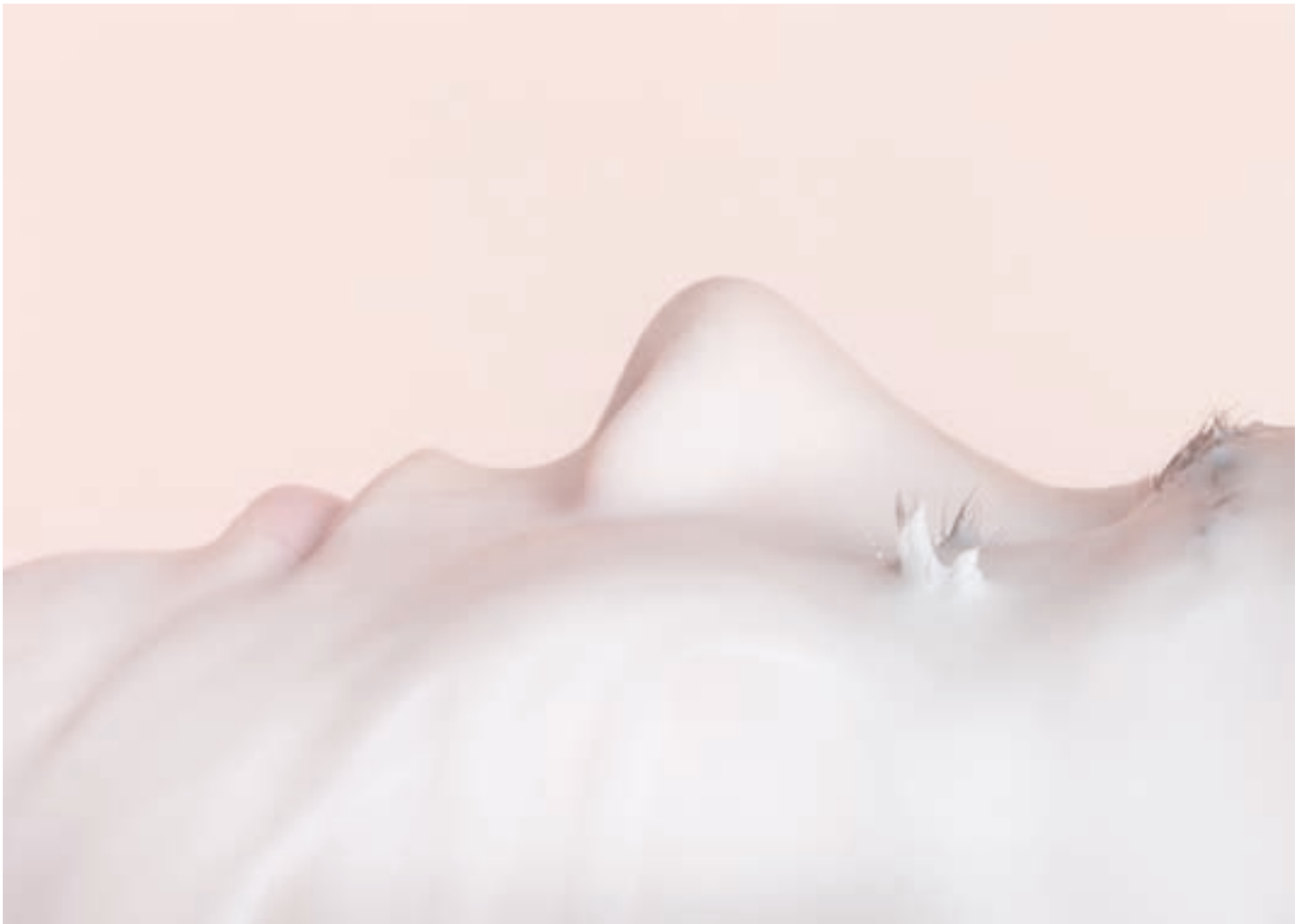
© Marta Zgierska, dalla serie Afterbeauty & votive figure

finisce, paradossalmente, per offrire solo l'ombra sfumata del bello e la distorsione del sentimento che questo da sempre suscita. Sono i dettagli delle opere a far pensare a questo messaggio. Se la tenuità dei colori richiama al femminile come interezza costituita in anima, corpo e spirito, i caratteri reali che spiccano qui e lì dicono di un'anima obliata cui può essere restituita la bellezza solo riconoscendole i tratti dell'individualità e di una fisicità che può permanere solidamente vera e bella solo se restituita al tempo, ai suoi segni distintivi ed alle sue reali passioni, gioie e dolori.